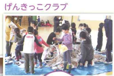
げんきっこクラブ