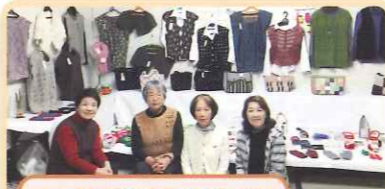
自治振興会文化祭