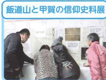
飯道山と甲賀の信仰史料展