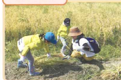
初めての稲刈り鎌、コンバイン試乗も、 貴重な体験です