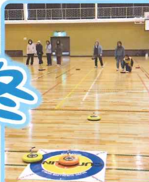
交流カローリング大会