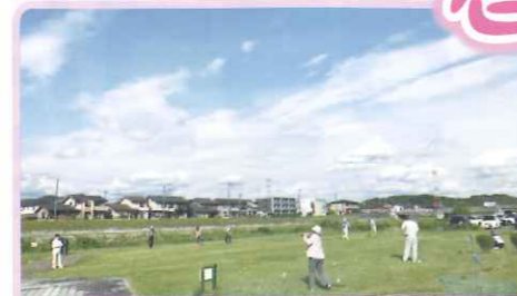
ターゲット・バードゴルフ教室