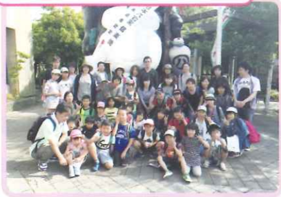
「MIHO ミュージアム」 スポーツだけでなく芸術鑑賞も